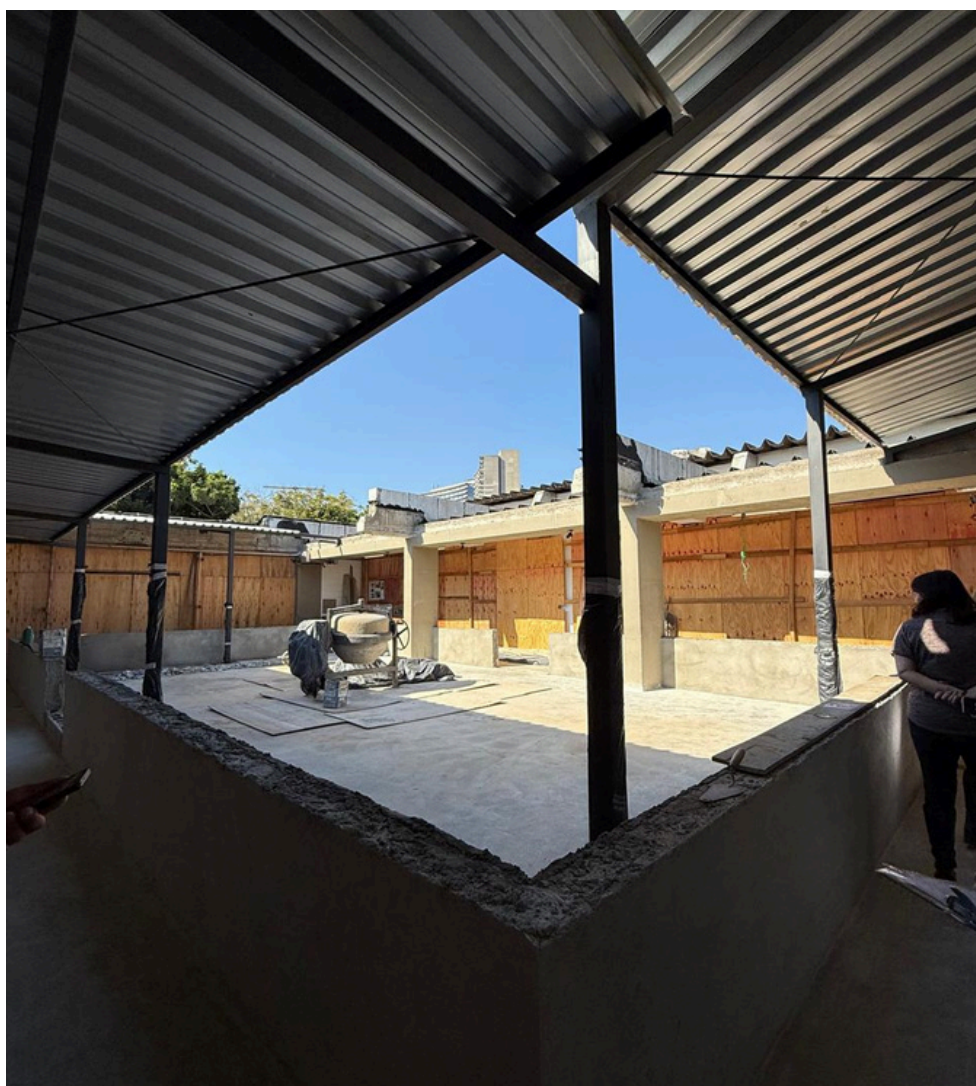
Término da reforma na laje