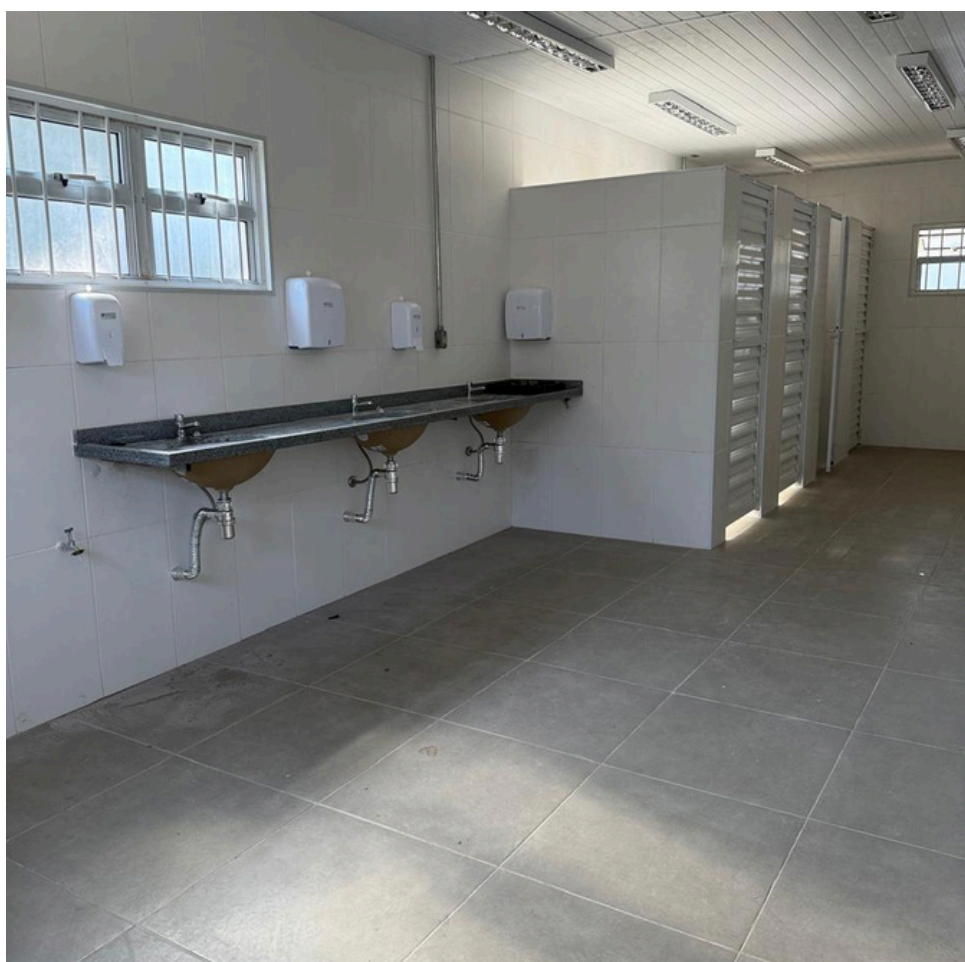
Vestiário GET 3

A reforma do prédio da GET 3 SE abrangeu diversas áreas, incluindo refeitório/copa, vestiários feminino e masculino e auditório. Entre as melhorias realizadas, destacam-se a substituição de pisos e janelas, serviços de pintura e outras intervenções voltadas à conservação e valorização do espaço.