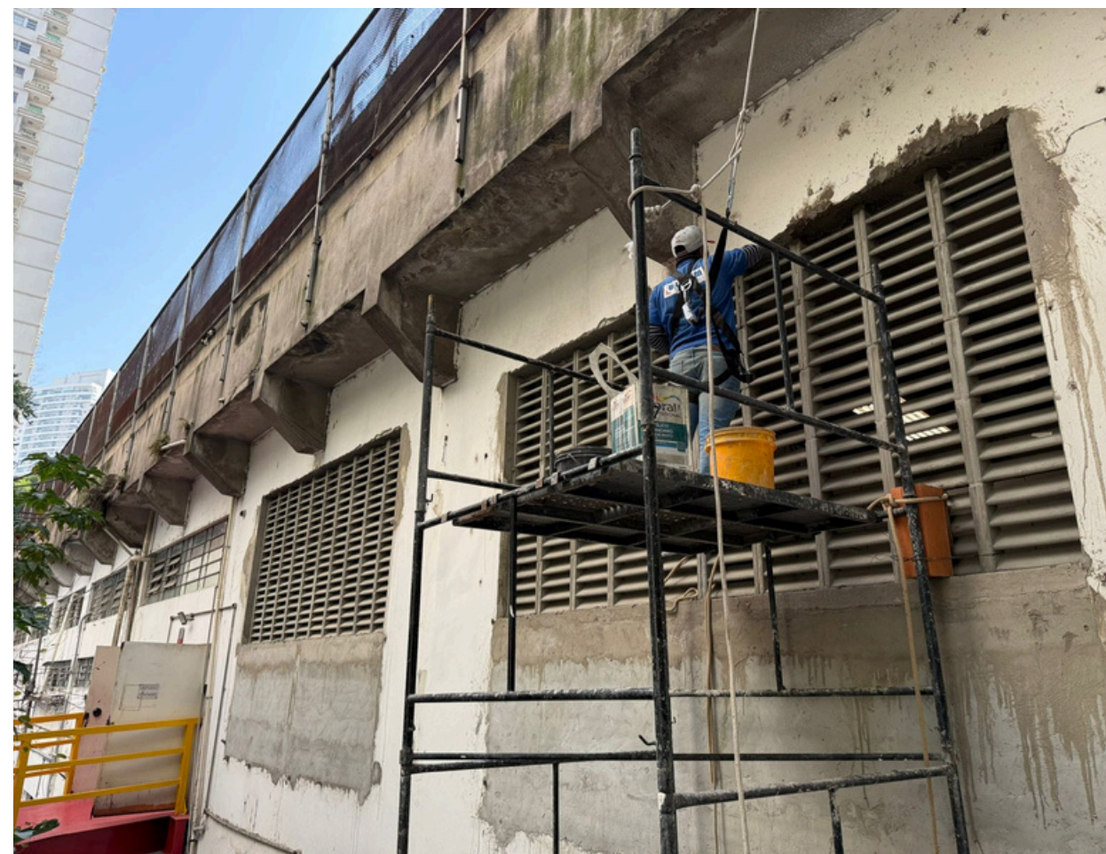
Serviços no Complexo Jacareí