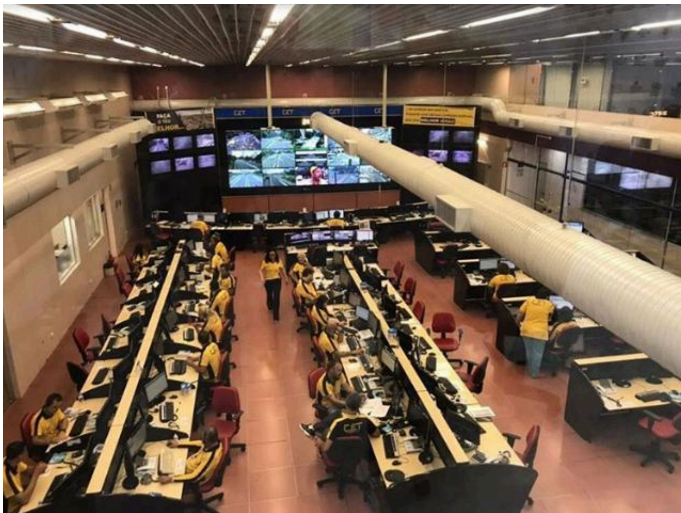
Central de Operação - Antes

A Central de Operações passou por ampla reestruturação, com troca de pisos, melhoria da iluminação, substituição de painéis e de toda a fiação elétrica. A Sala de Estratégia recebeu piso novo e pintura, enquanto a laje do edifício da Bela Cintra foi totalmente readequada.