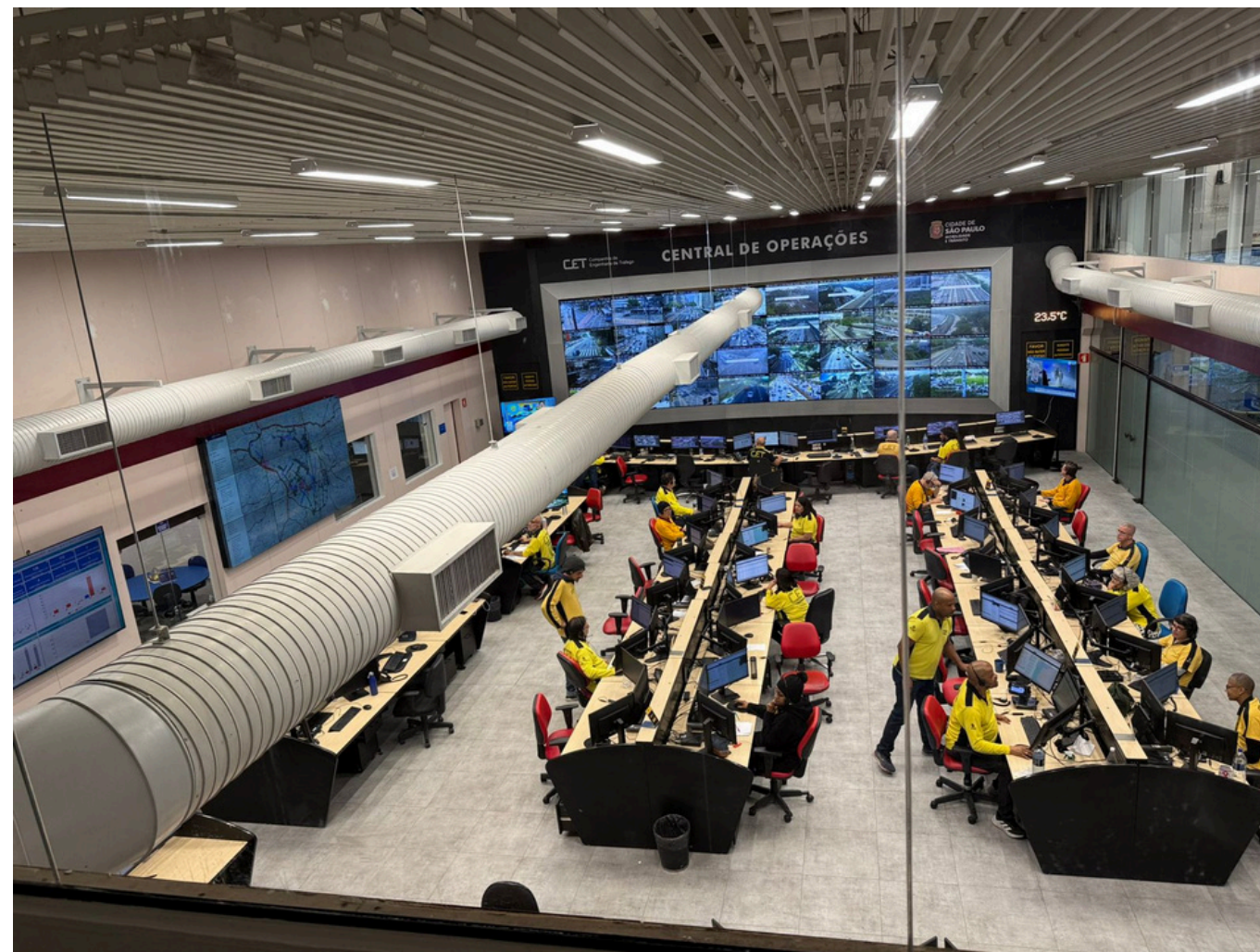
Central de Operação - Depois