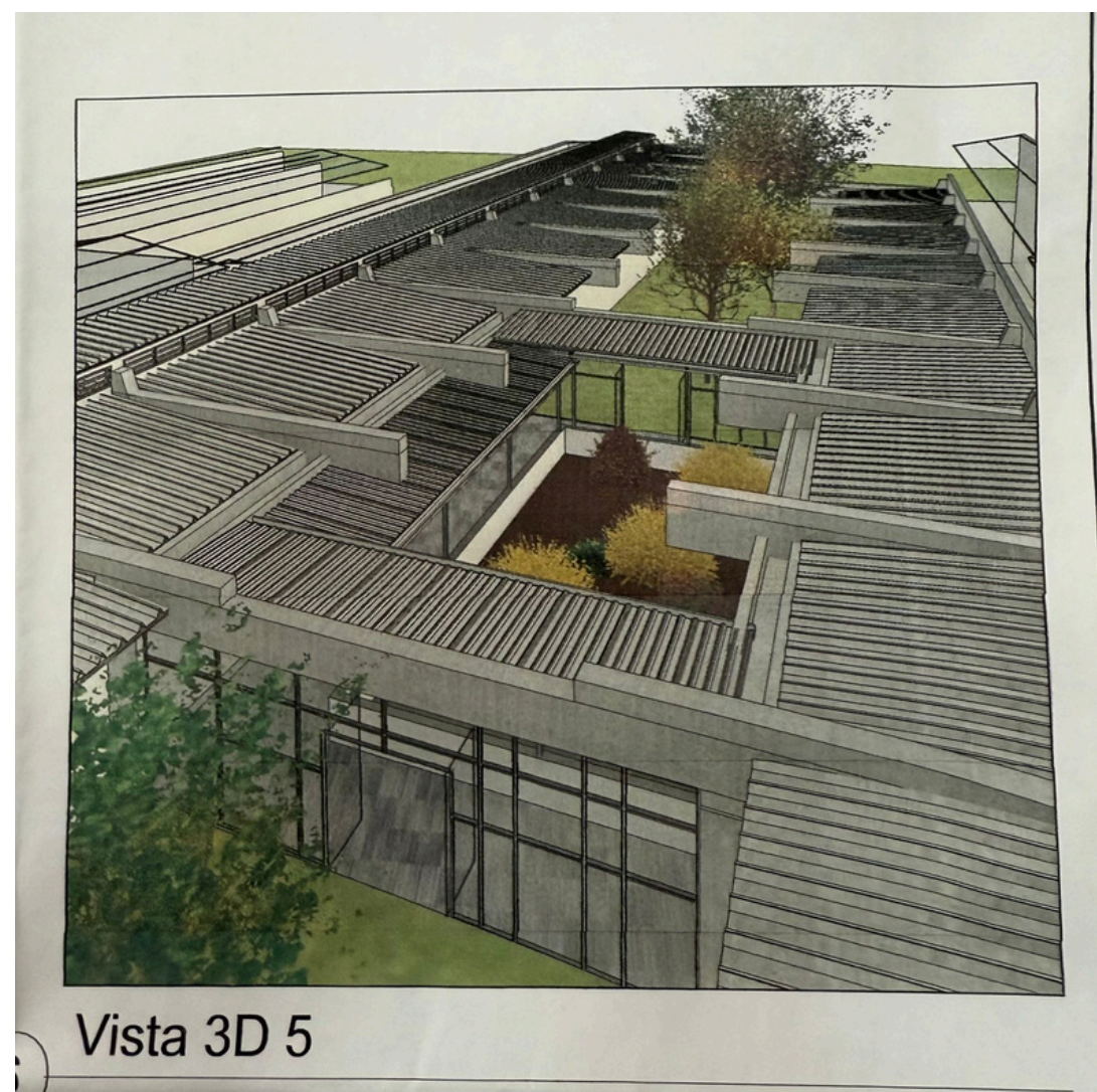
Projeto futuro em análise