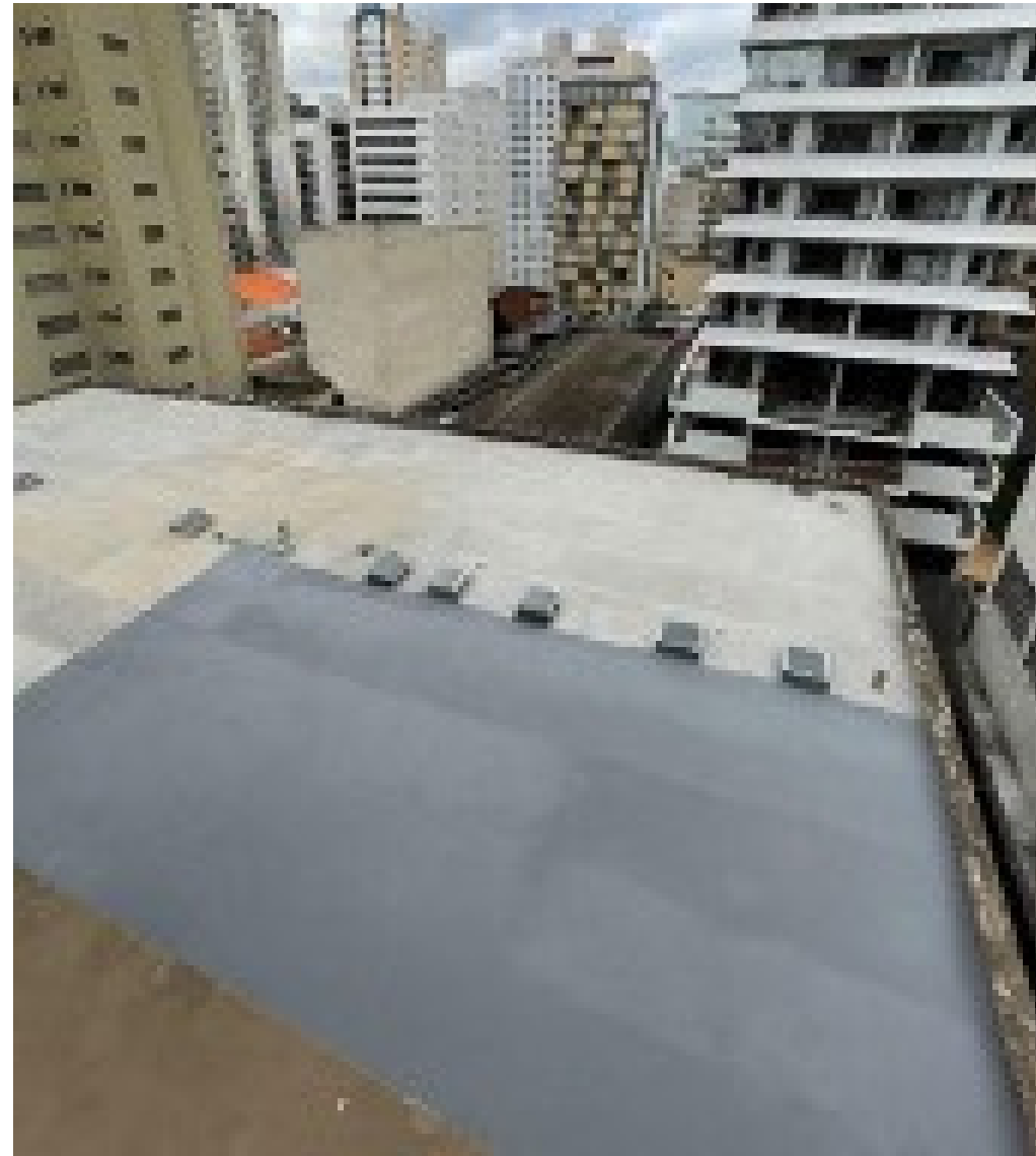
Laje Bela Cintra em fase final