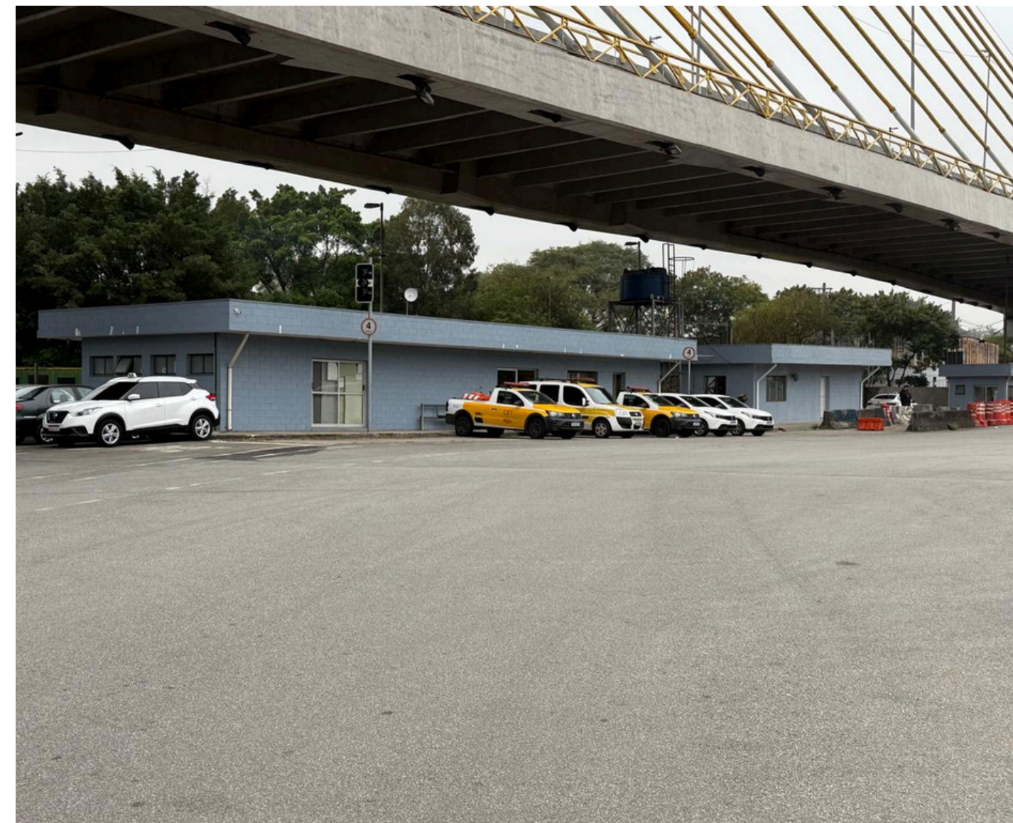
Reformas feitas no Complexo Estaiadinha